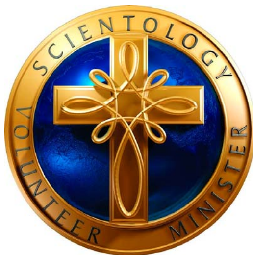
Il. 1. Logo Volunteer Ministers